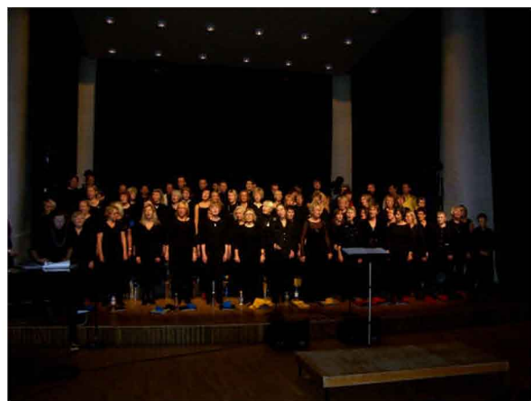
Poliskören in action

Aftonens lilla sångkompott har sin tonvikt mot lättsammare underhållning, som ett glatt Klobben-jubileum påbjuder.