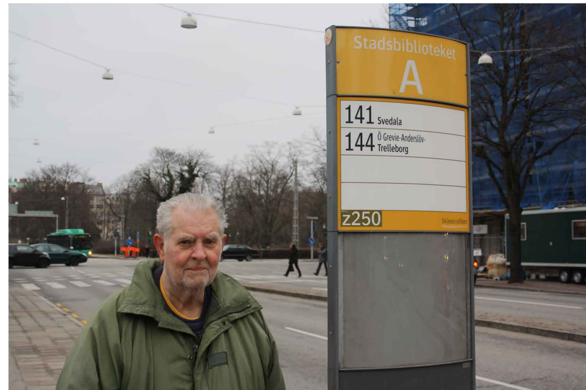
På väg hem från ett svettigt gympapass